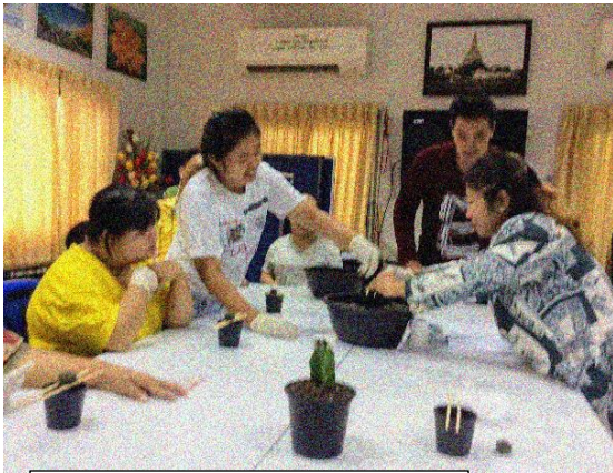
สุขจากแคคตัส สานสายใยรักแม่ลูก

ความจริง ถ้าพ่อแม่ยังทุกข์ ท้องยังหิว ต้องดิ้นรนหากินเลี้ยงปากเลี้ยงท้อง การมีเวลาให้ลูกและเลี้ยงลูกเชิงบวก เป็นเรื่องยาก กิจกรรมแคคตัส ไม้แห่งความหวัง เพื่อเด็ก คนพิการ และครอบครัวยากลำบาก ช่วยสร้างรายได้เสริมให้แก่ครอบครัวเด็กที่ยากจน ว่างงาน ฝึกวิชาชีพ ให้มี โอกาสพัฒนาตัวเองและครอบครัวไปด้วยกัน โดยไม่รอความช่วยเหลือ จึงเป็นการพัฒนาที่ยั่งยืน