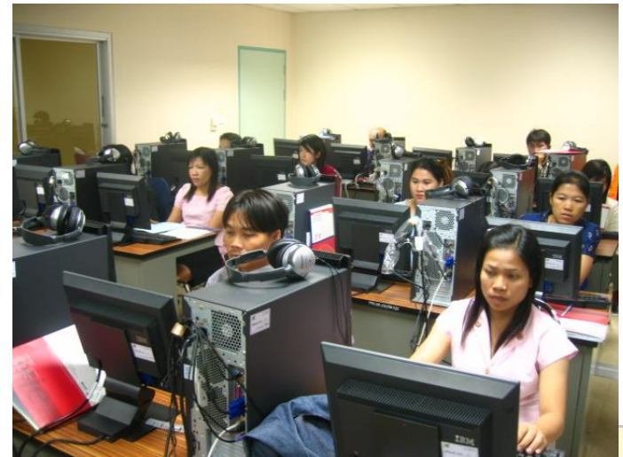
การฝึกอบรมในจังหวัดอุดรธานี มกราคม ๕๘